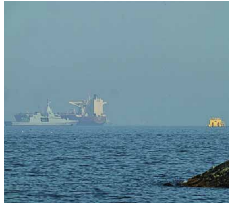
Nueva medida. Las navieras podrían ser sancionadas si realizan pagos al gobierno iraní para transitar de manera segura por Ormuz.

La advertencia incluyó no sólo transferencias en efectivo, sino también activos digitales, compensaciones, intercambios informales, pagos en especie e incluso donaciones canalizadas a través de embajadas iraníes.