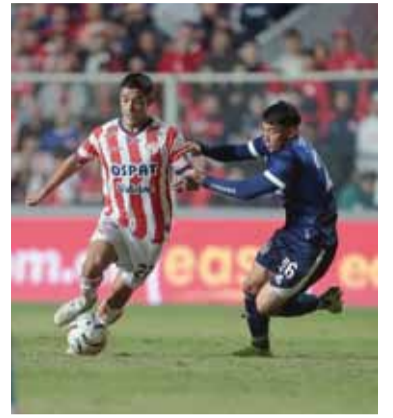
De momento, está en playoffs.

Unión de Santa Fe empató 1-1 con Talleres de Córdoba en el estadio 15 de Abril, en el partido postergado de la novena fecha del Grupo A del Torneo Apertura, y pelagra su clasificación a la fase final.