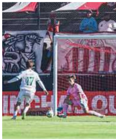
Chance. Perrota ante Espínola.

El gol cambió el ritmo del partido. El local creció en confianza y generó algunos minutos de incer-