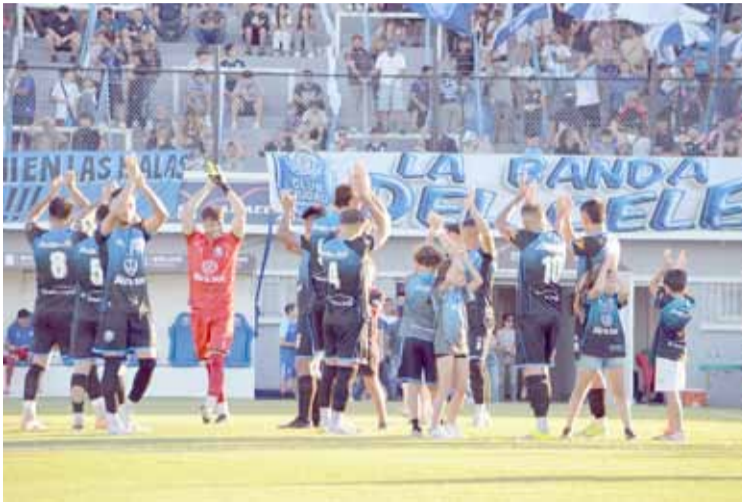
Viene bien y quiere más. Después de ganar en Salta, el Celeste se presenta en el estadio, frente a un histórico.

En cuanto a un aspecto destacado, el encuentro contará con la presencia de público visitante, en