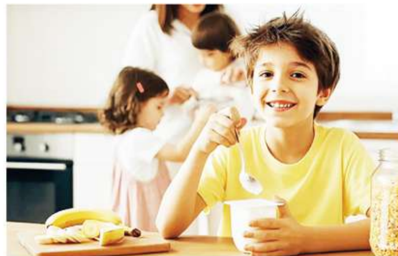
Fundamental. El yogur es una importante fuente de calcio para los chicos.

Los beta-glucanos de la avena se disuelven en agua y forman un gel viscoso en el tracto digestivo: actúan atrapando al colesterol LDL y ayudan a eliminarlo del cuerpo antes de que sea absorbido en el torrente sanguíneo.