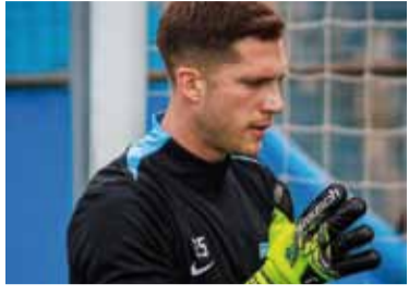
Cambeses, listo para la "final".

Racing Club de avellaneda enfrenta a Huracán desde las 16 en el estadio Presidente Perón, por la novena fecha del Grupo B del Torneo Apertura. El árbitro será Leandro Rey Hilfer, secundado por Yamil Possi en el VAR.