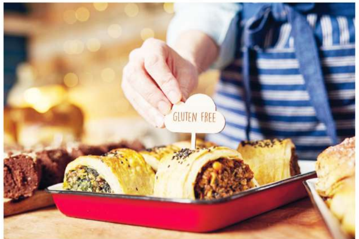
Calidad de vida. Cada vez hay más alimentos libres de gluten.

Detectarla a tiempo es clave para evitar complicaciones a largo plazo, como osteoporosis precoz o anemia severa. El diagnóstico se realiza a través de análisis de