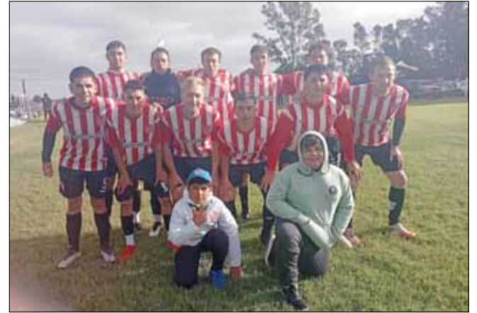
Formación de Arboledas en la primera fecha.

A las 13.45 comienzan los partidos de Segunda y desde las 15.45, los encuentros de Primera división.