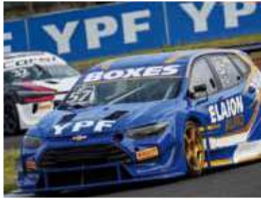
El Chevrolet Tracker dominó la pista.

Franco Vivian fue el gran dominador de la clasificación del TC2000 en el autódromo "Ciudad de Concordia" al marcar 1m41s197 con el Chevrolet Tracker del Pro Racing. El piloto porteño se quedó con la pole position sumando sus primeros puntos fuertes de la temporada.