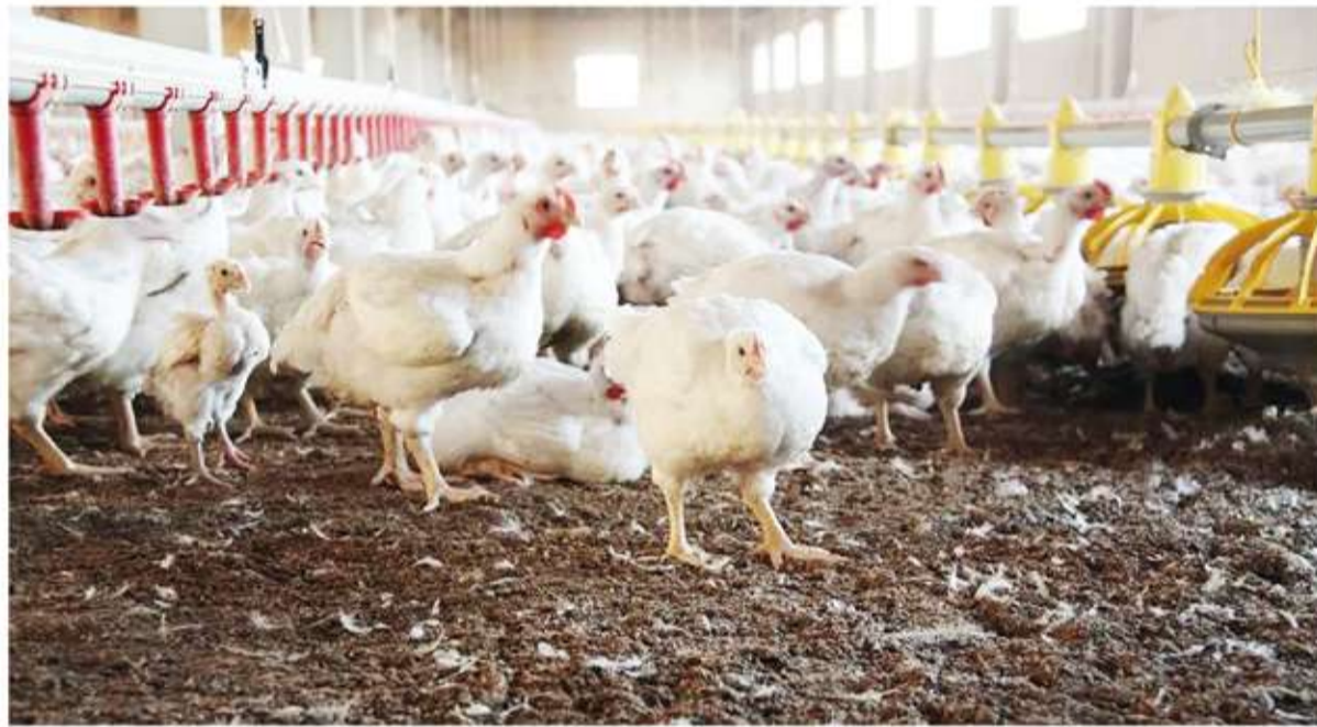
Aves sanas. El país restituyó su estatus de país libre de IAAP.

Es tras confirmarse el cierre de los cuatro brotes en aves de corral ocurridos en localidades bonaerenses y cordobesas y no haberse registrado otro caso en establecimientos comerciales.