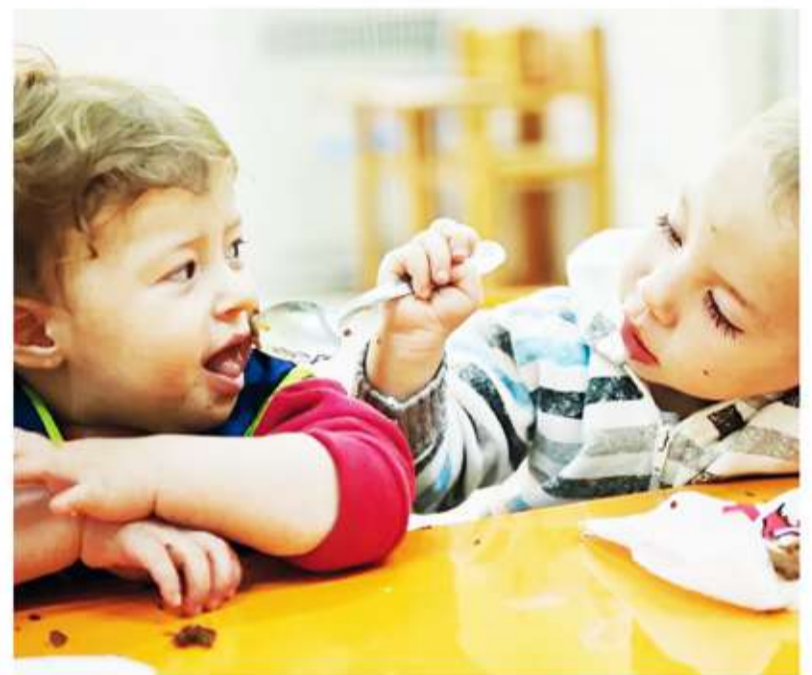
Todo comienza en el plato. Buscan mejorar el aporte de nutrientes esenciales en la infancia.

Este efecto positivo de reducir el déficit de calcio se observa sin modificar el resto del patrón alimentario, lo que refuerza la relevancia de intervenciones simples y concretas en contextos