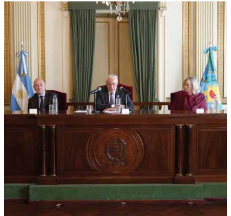
Viejo reclamo. La presentación que hizo la Corte puso en primer plano un proyecto de ley para dotar de autarquía al Poder Judicial.

Una encuesta de la consultora brasileña Atlas-Intel, que funciona en tándem con la agencia de noticias financiera estadounidense Bloomberg, confirmó lo que ya se sabía: que Milei está en su piso de imagen positiva, entre el 30 y el 35%. Pero agregó un dato sorprendente: en la cima de ese ítem aparece la trotskista Miriam Bregman, seguida de Kicillof y de Cristina Kirchner, en ese orden. No se trata de intención de voto, sino de imagen, lo que implica una diferencia fundamental. Pero consolida una idea con impacto concreto en el escenario: la que, hoy, la de que hoy les va bien a quienes se diferencian en forma